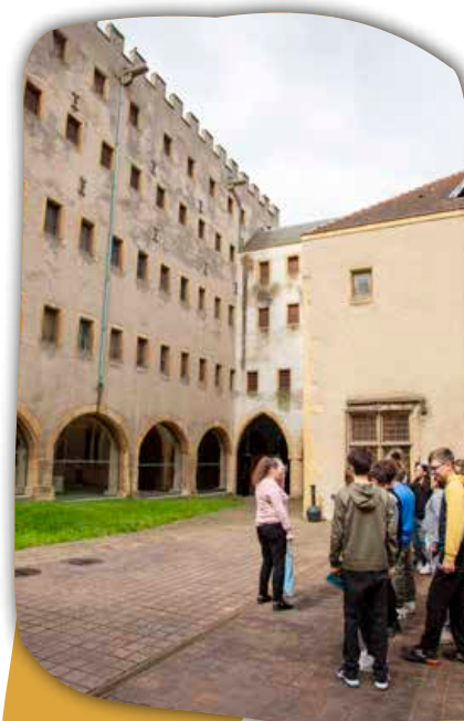
La cour de Chèvremont