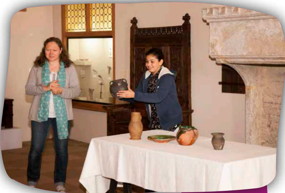
Dresser une table médiévale

La thématique « Vie quotidienne au Moyen Âge » est fondée sur l'observation d'éléments architecturaux et d'objets médiévaux. De cette manière, les élèves découvriront comment vivaient les bourgeois de Metz à cette époque et dresseront la table devant la cheminée.