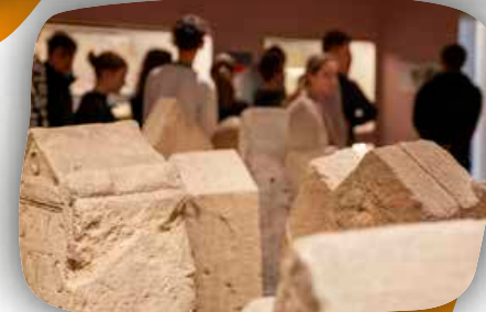
Traduire des stèles antiques.

Entrez dans les thermes datant du II e siècle conservés au musée et enquêtez sur leur fonctionnement et leur importance dans la cité gallo-romaine.