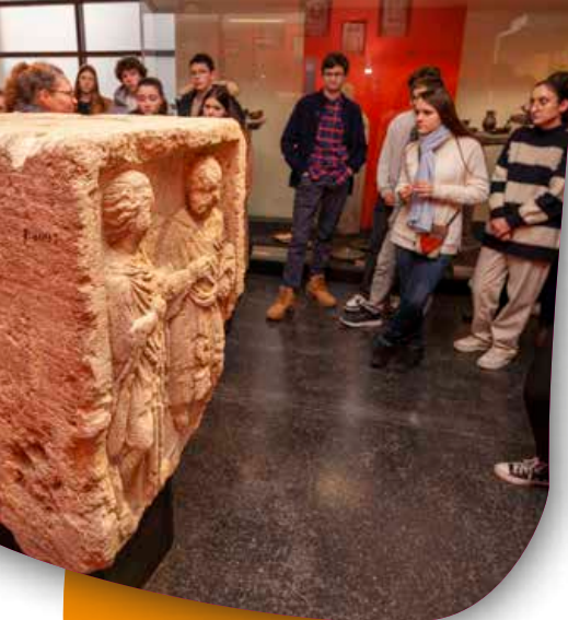
La place de la femme dans le couple gallo-romain