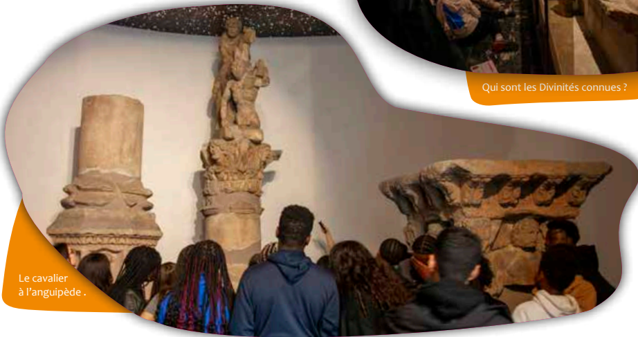
Le cavalier à l'anguipède.

Ce parcours s'appuie sur des documents épigraphiques montrant l'évolution des croyances et des mentalités entre le I er et le V e siècle après J.-C.