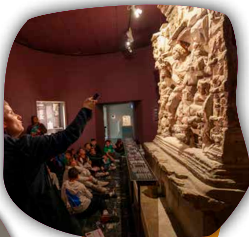
Qui sont les Divinités connues ?

Première visite tournée vers les mathématiques ! Révision du vocabulaire lié au cube et repérage des symétries sur les mosaïques antiques seront au programme tout comme des manipulations de cubes et des dessins de figures par symétrie. De nombreux prolongements à cette visite sont possibles de façon pluridisciplinaire.