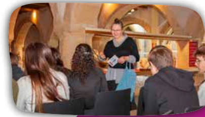
Les cartes de métiers des musées