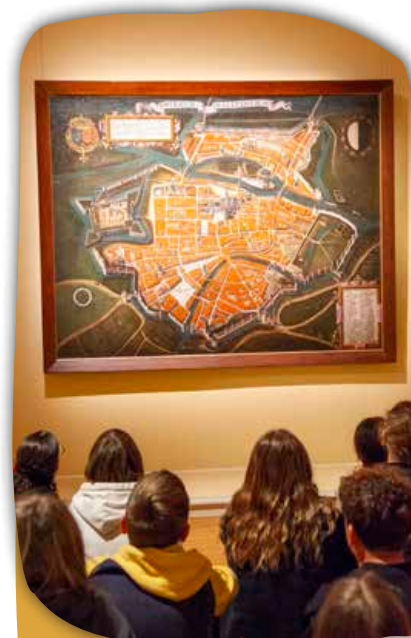
Découvrir la société urbaine messine médiévale

Durant cette visite, les élèves découvrent la cité médiévale de Metz, avec ses particularités (son gouvernement, son économie et son architecture).