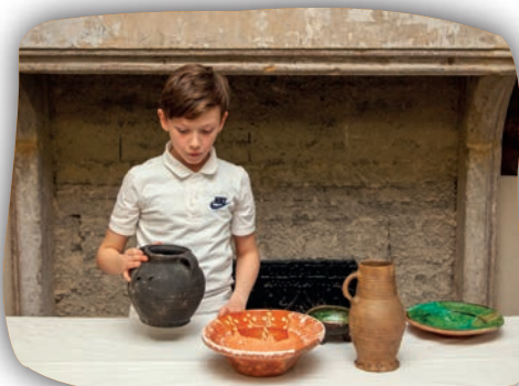
Dresser la table au Moyen Âge

Comment vivait la bourgeoisie messine au Moyen Âge ? Entrons dans leurs demeures et dressons la table devant la cheminée.