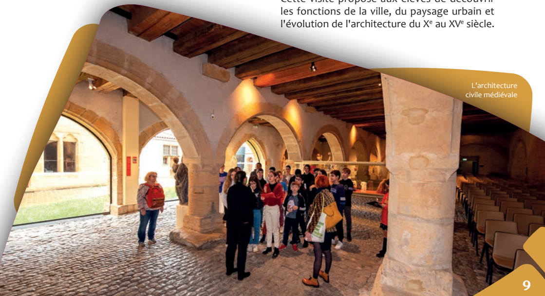
L'architecture civile médiévale

Cette visite propose aux élèves de découvrir les fonctions de la ville, du paysage urbain et l'évolution de l'architecture du X e au XV e siècle.