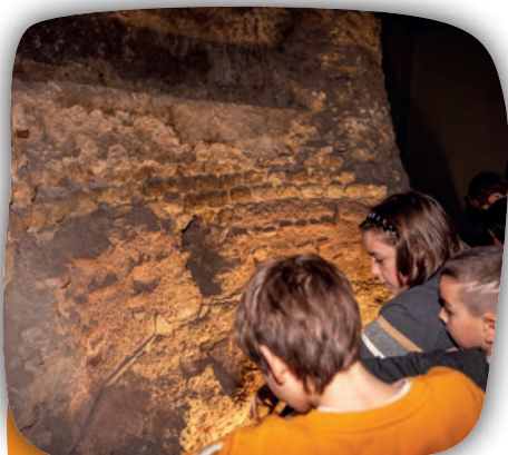
Les murs des thermes in situ

Entrez dans les thermes datant du II e siècle conservés au musée et enquêtez sur leur fonctionnement et leur importance dans la cité gallo-romaine.