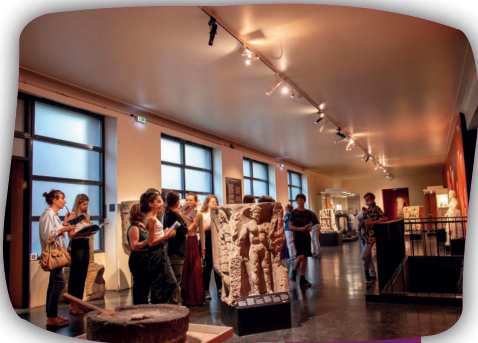
Découverte des collections gallo-romaines

La thématique « Vie quotidienne au Moyen Âge » est fondée sur l'observation d'éléments architecturaux et d'objets médiévaux. De cette manière, les élèves découvriront comment vivaient les bourgeois de Metz à cette époque et dresseront la table devant la cheminée.