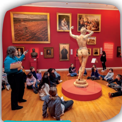
Un accrochage inspiré du XIX e siècle