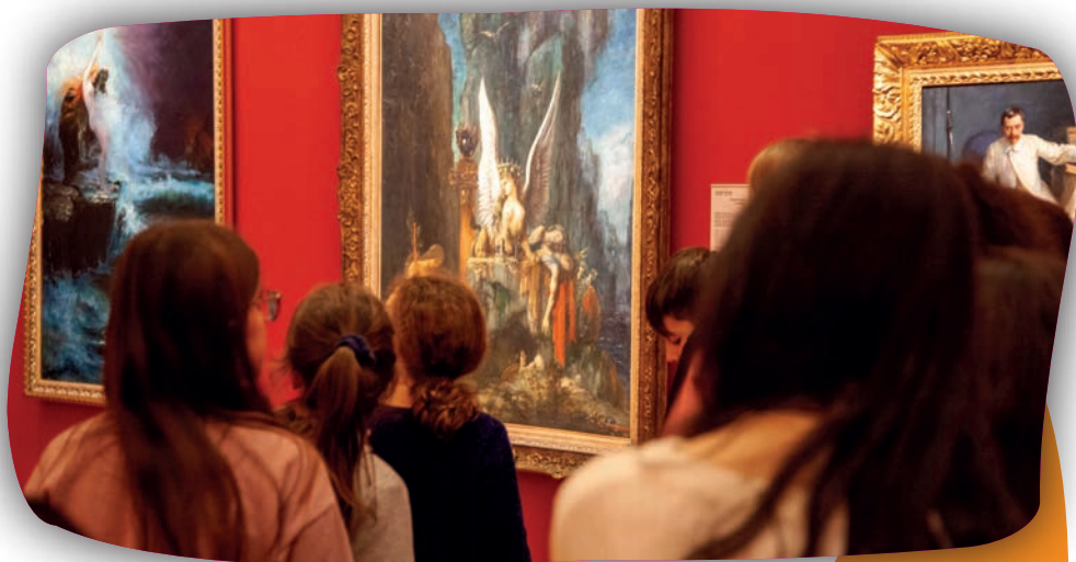
La Sphinge dévoreuse d'hommes