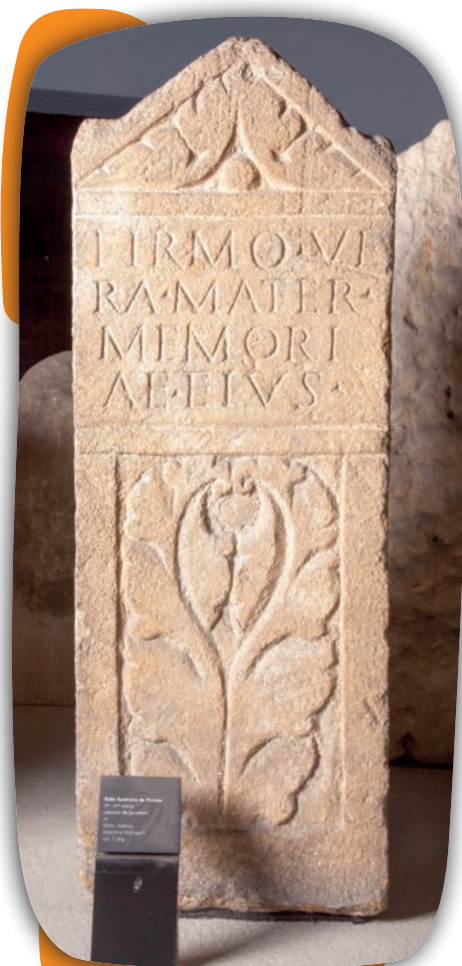
Savez-vous traduire l'inscription ?

Initiation à l'épigraphie pour découvrir, lire et comprendre les inscriptions funéraires et religieuses, l'évergétisme, les titulatures. Des documents complémentaires à exploiter en classe sont proposés en prolongement de la visite au musée.