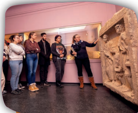
Décrire une femme gallo-romaine

Première visite tournée vers les mathématiques ! Révision du vocabulaire lié au cube et repérage des symétries sur les mosaïques antiques seront au programme tout comme des manipulations de cubes et des dessins de figures par symétrie. De nombreux prolongements à cette visite sont possibles de façon pluridisciplinaire.