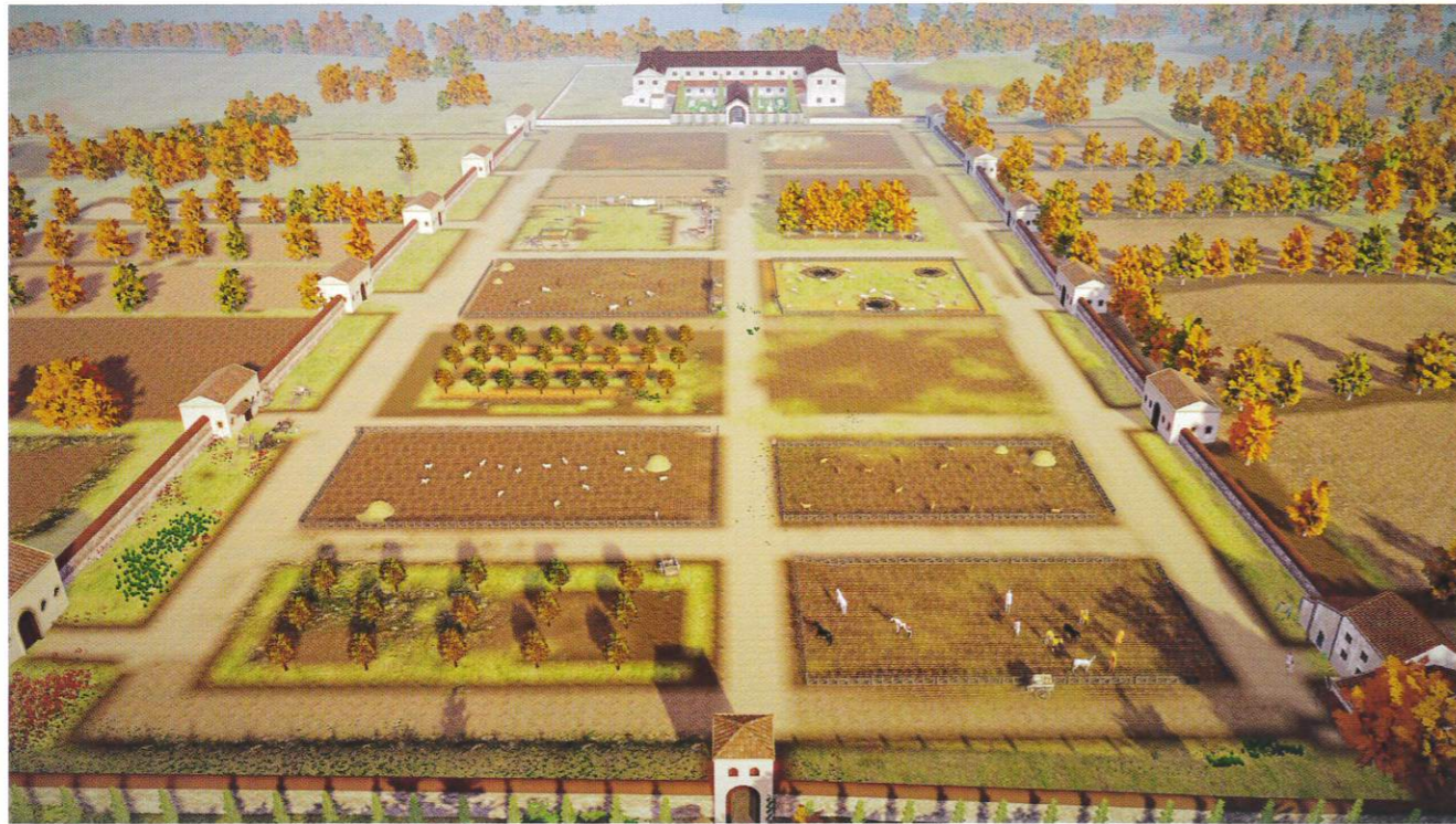
Évocation de la villa de Reinheim.