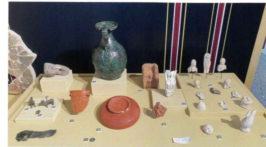
CI-CONTRE. Vitrine dédiée à la religion antique dans la galerie d'exposition permanente de Bliesbruck.